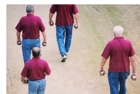
Cartographie 9 – La Boule d'Or , Bruno Deville, 2008, 12' Sous un pont les boules de pétanque deviennent chorégraphes.