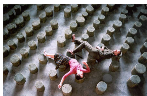
Cartographie 6 – La Vallée de la jeunesse , Fernand Melgar, 2005, 26' La voûte résonne encore des paroles de Ramuz, tandis que l'apesanteur menace.