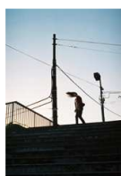
Cartographie 8 – L'îlot , Mario Del Curto, 2008, 13' Le terminus du bus, la fin d'une ville ; le début de tous les possibles.